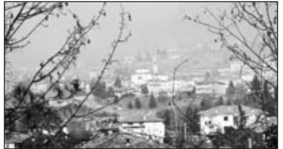
Albino vista dall'alto