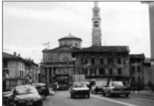
Anche a Seriate si lavora alla stesura del locale Piano di zona

S i sono svolti tra la fine di gennaio e l'inizio di questo mese una serie di incontri pubblici organizzati unitariamente da Spi Cgil, Fnp Cisl e Uilp Uil per illustrare e discutere i Piani di zona dei servizi sociali e assistenziali di ciascun distretto. I relatori, vale a dire i responsabili politici (sindaci o loro delegati) delle assemblee dei distretti ed i responsabili tecnici (funzionari che hanno curato la stesura dei Piani), hanno presentato gli indirizzi politici, le priorità scelte ed i contenuti salienti in materia sociale e assistenziale del Piano di ciascun distretto. Si è quindi parlato di segretariati sociali, di pasti caldi a domicilio per gli anziani in difficoltà, di assistenza domiciliare integrata, ecc. Sono stati inoltre raccolti ed acquisiti suggerimenti ed osservazioni emersi nel dibattito seguito alle presentazioni. Si è trattato dunque di un'importante iniziativa, per due ordini di ragioni: i pensionati hanno cominciato a conoscere le decisioni e le scelte sociali e assistenziali che li riguardano direttamente nel proprio territorio di residenza; sono inoltre ripresi concretamente i rapporti unitari, utili soprattutto a far sentire con la dovuta considerazione alle istituzioni competenti le rivendicazioni e le richieste dei pensionati bergamaschi. Questi rapporti, pur tra le difficoltà che si sono registrate in un recente passato, potranno proseguire positivamente, avendo a mente l'obiettivo comune di tutelare e promuovere