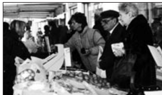
È sempre più preoccupante l'aumento del costo della vita, come ognuno può constatare ogni giorno facendo la spesa

Insomma, il saldo netto tra sgravi fiscali ed aumenti vari (addizionali, ticket, caro vita, servizi) continua a peggiorare il proprio segno negativo per le tasche dei lavoratori e dei pensionati.