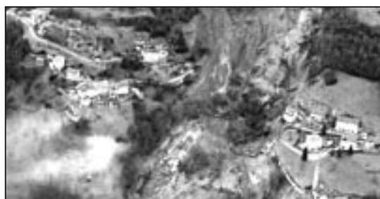
Nella fotografia aerea, gentilmente concessa dall'Amministrazione comunale di Brembilla, la frana che ha devastato la località di Camorone.

L a solidarietà è, da sempre, elemento fondante per un'organizzazione di lavoratori come la Cgil. I problemi - spesso i drammi - del lavoro, certo, ma anche le altre avversità la colpiscono e la riguardano. Anche per questo non può rimanere sorda alle difficoltà recentemente causate alle popolazioni (vicine e non) colpite da eventi distruttivi. Dopo la raccolta di fondi organizzata dalla Fiom che in brevissimo tempo ha raccolto nelle aziende metalmeccaniche locali oltre 3 mila euro per le famiglie degli operai Fiat di Termini Imerese, è attualmente in corso una sottoscrizione per le popolazioni delle Valli bergamasche e del Molise colpite da calamità naturali. Coloro che lo desiderano possono delegare la loro azienda a versare 1 ora di lavoro sul c/c 3576 intestato a Nord Sud Bergamo e Molise, Codice Abi 1025 Cab 11101 presso Banca S. Paolo Imi Filiale 8012, Bergamo via XX Settembre 57. Lo stesso conto può essere utilizzato anche per eventuali versamenti individuali.