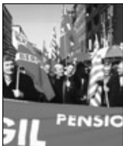
I momenti di mobilitazione danno forza alle politiche sindacali

Alla vigilia dell'adozione dell'Isee (detto anche "ricometro"), si intende sviluppare un confronto con i Comuni, affinché nei bilanci siano previste più risorse a favore degli anziani, per accrescere e sviluppare i servizi sociali e l'assistenza domiciliare. In questo quadro è stata richiesta