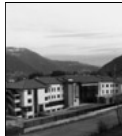
Nella struttura di Laxolo accedevano anziani di 6 paesi della zona